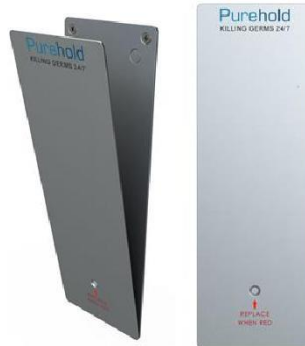
Purehold PUSH Antibakterielle Türdrückerplatte