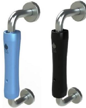
Purehold PULL Antibakterielle Türgriffabdeckung