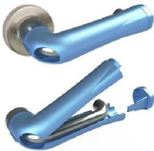
Purehold LEVER Antibakterielle Türgriffabdeckung