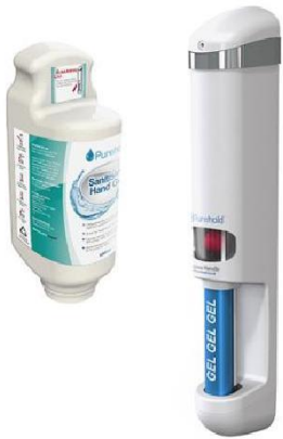
Purehold PRO Gelspender Türgriff